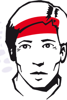
Typische lokalisatie van spanningshoofdpijn

Spanningshoofdpijn is de meest voorkomende vorm van hoofdpijn . Mannen en vrouwen worden er in gelijke mate door geplaagd. De pijn zit meestal aan beide kanten van het (voor)hoofd. Het voelt aan alsof er een strakke band om het hoofd zit.